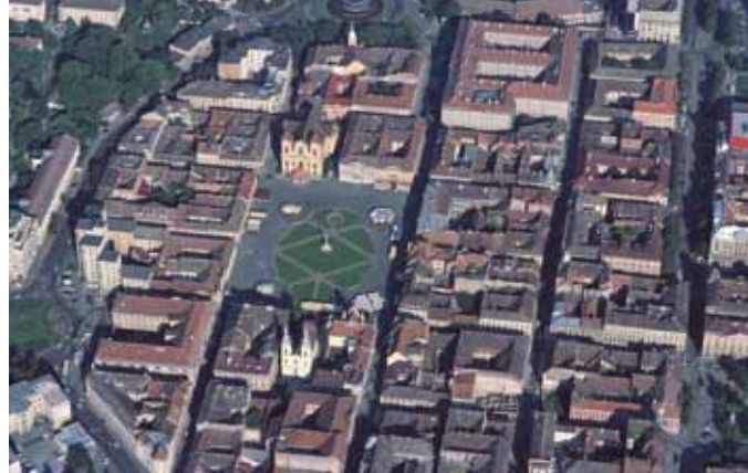
Gesamtaufnahme der Inneren Stadt

Parallel zum Festungsbau wurde der Innenbereich neu geplant. Dabei wurden die Straßen in Form von senkrecht verlaufenden Längsgassen, die von gleichbreiten Quergassen im rechten Winkel geschnitten wurden, angelegt. Die ursprünglichen repräsentativen Mittelpunkte der Stadt aus dem 18. Jahrhundert sind der Domplatz im Norden, Zentrum der Hauptkirchen und der Verwaltung, und der Paradeplatz im Süden, Zentrum des Militärs und des Bürgertums.